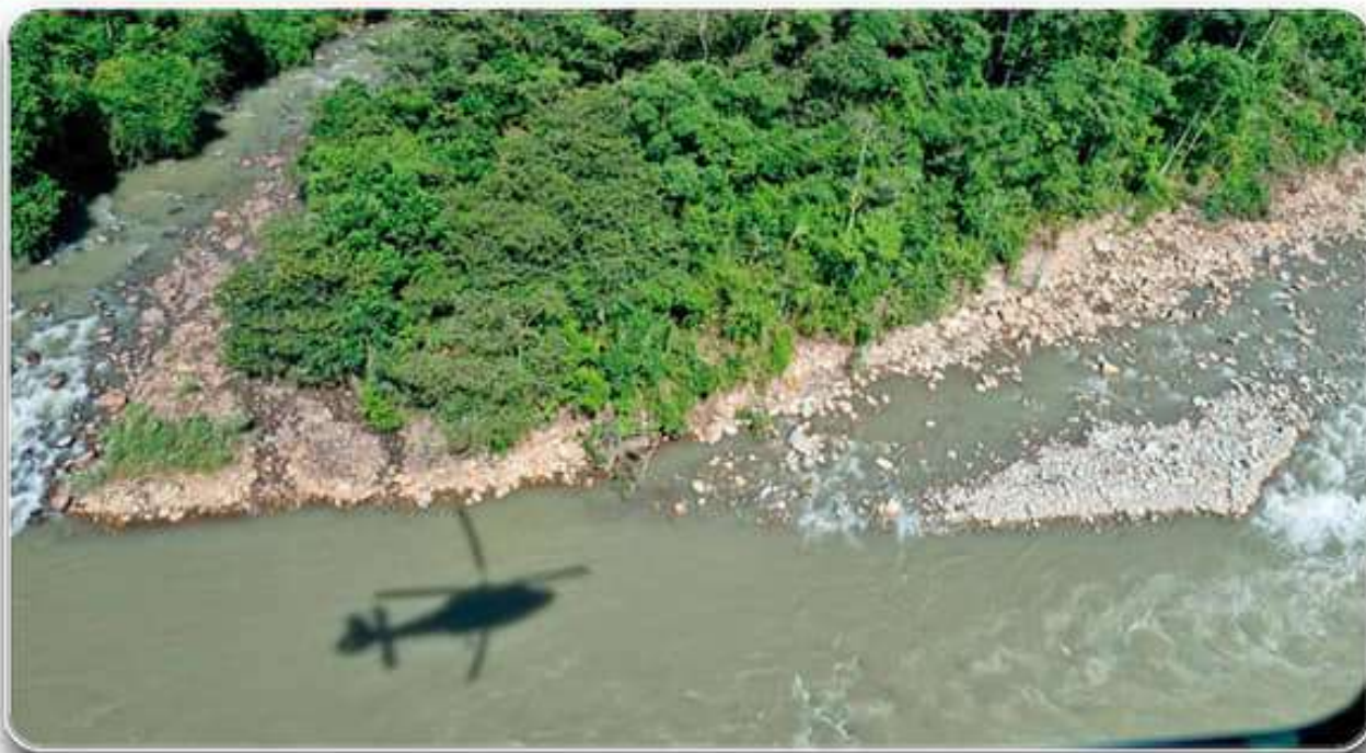
Operación militar helitransportada de extracción.

El Comando General del Ejército a través de la Dirección de Aviación del Ejército, con la Unidad dependiente, el Grupo de Caballería Aérea – I “Gral. Apóstol Santiago” y el Grupo de búsqueda y rescate (SAR-FAB), activando el plan de llamadas de acción inmediata de la Unidad, realizaron la Planificación y Ejecución de la Operación Militar Helitransportada de reconocimiento y extracción de dos cuerpos encontrados sin vida, en la localidad de Pojo a 176 Km. de la ciudad de Cochabamba, (a orillas del Río San Mateo), en la Zona de Pampa Colorada, con una aeronave Z9-H425 con matrícula EB-106.