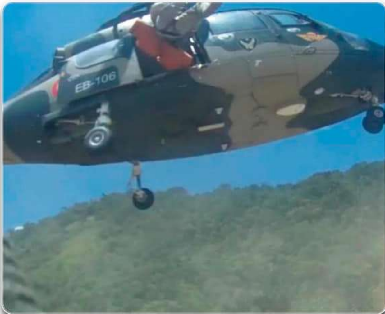
Evacuación de los cuerpos encontrados.

Helitransportadas, para continuar con la búsqueda y rescate de los cuatro cuerpos restantes de las personas desaparecidas en el Municipio de Pojo, ejecutando operaciones en coordinación con la Unidad de Gestión de Riesgo de la Gobernación de Cochabamba (UGR), Bomberos, Grupo SAR y el Viceministerio de Defensa Civil.