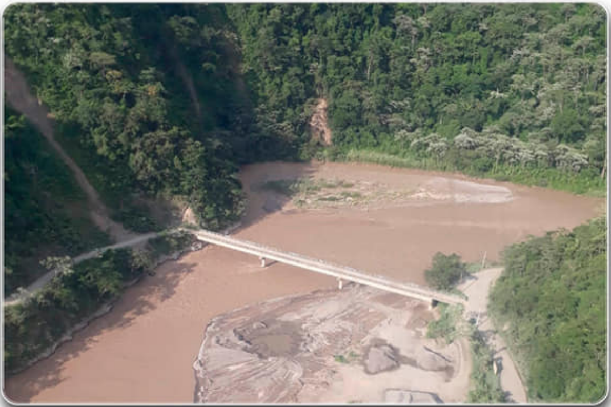
Sobrevuelo en el área del municipio de "La Asunta" sobre el Río Boopi.